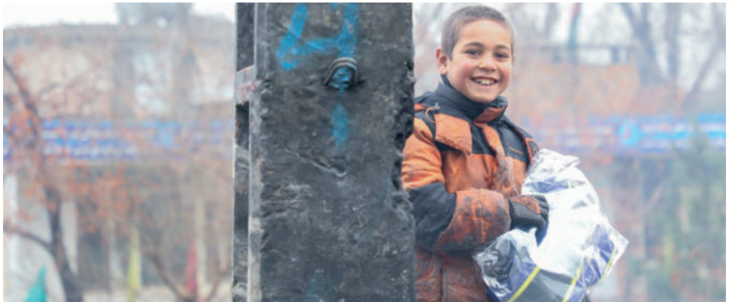
یوه ډالی، یوه مسکا کمپاین