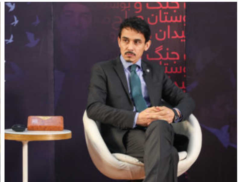
جریان مناظره محصلان برنامه ماستری روابط بین الملل پوهنتون کاردان در شبکه جهانی طلوع نیوز